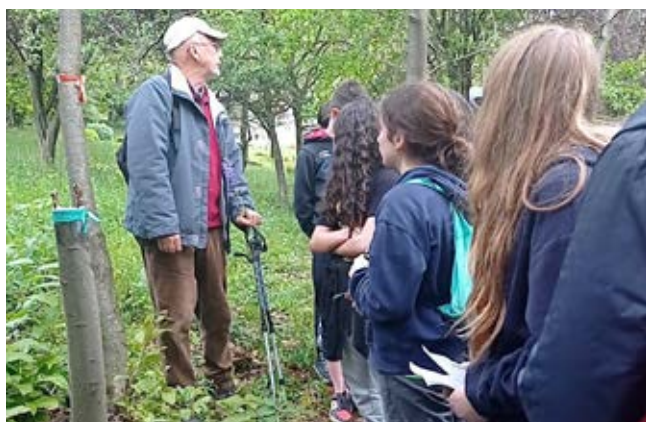
Adottiamo un’associazione. Passeggiata tra i boschi con il CAI