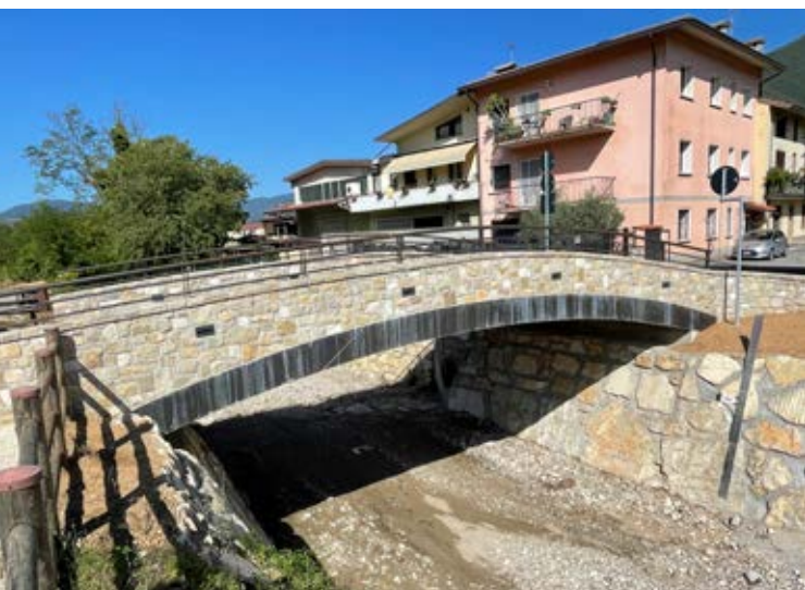
Nuovo ponte in via San Giuseppe

Il costo dell'opera a consuntivo è pari ad €. 521.285,95 di cui 233.181,95 finanziati con fondi propri dell'ente, €. 120.000,00 con contributo della Provincia di Brescia, €. 45.000,00 con contributo della Comunità Montana di Valle Trompia, €. 60.000,00 con contributo di Regione Lombardia, €. 12.295,00 di sponsorizzazioni ed €. 50.809,00 di compartecipazione degli enti gestori dei sottoservizi.