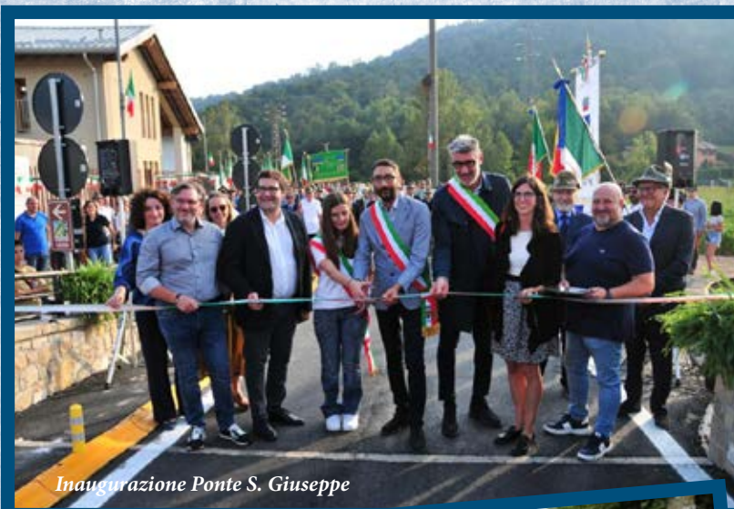
Inaugurazione Ponte S. Giuseppe