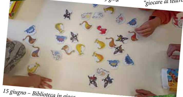
15 giugno – Biblioteca in gioco