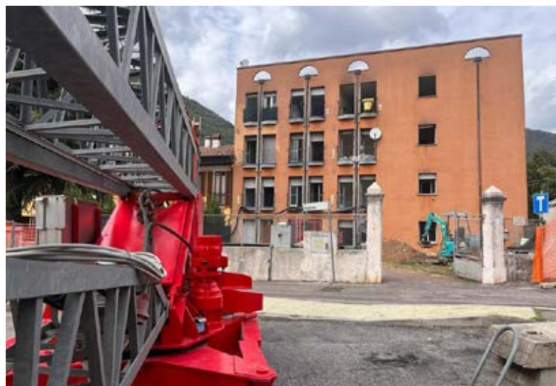
Via Ospitale, condominio