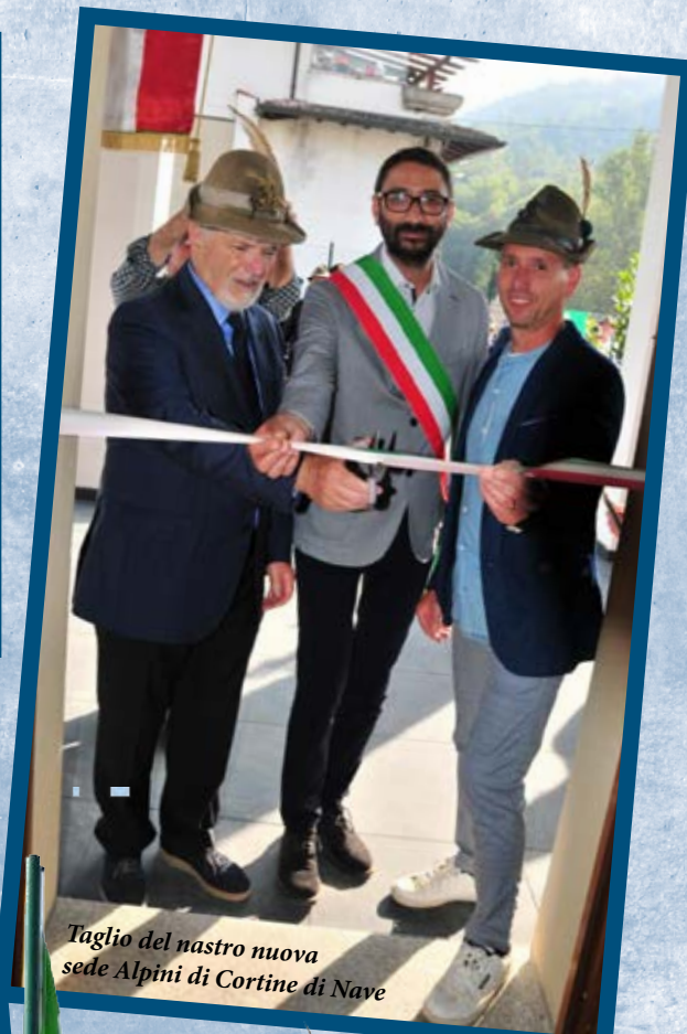
Taglio del nastro nuova sede Alpini di Cortine di Nave