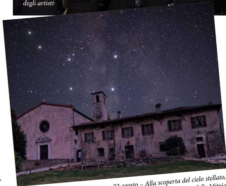
22 agosto – Alla scoperta del cielo stellato, alla Pieve delle Mitria