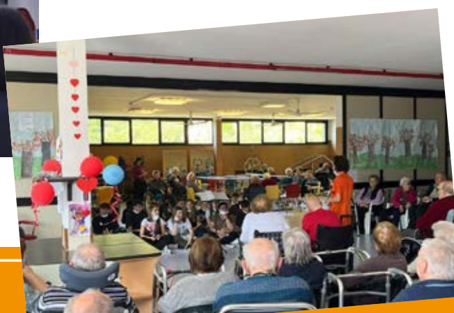
La scuola incontra l’RSA