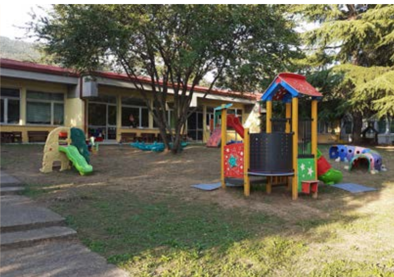
Scuola dell'infanzia di Muratello

Inizieranno entro la fine dell'anno i lavori di miglioramento sismico della scuola primaria "Don Milani" che saranno realizzati grazie ai due contributi, uno statale di €. 1.790.000,00 a valere sui fondi del PNRR e uno regionale di €. 800.000,00.