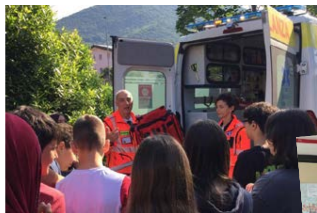
Adottiamo un’associazione. Giornata d’incontro con il COSP: i volontari del soccorso pubblico