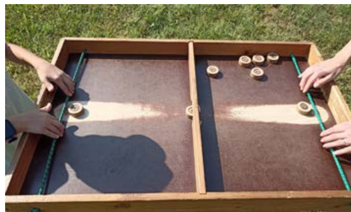
9 settembre – Nave smiles Park