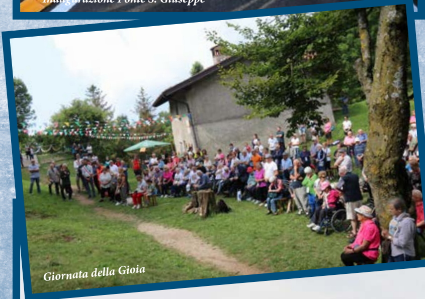
Giornata della Gioia