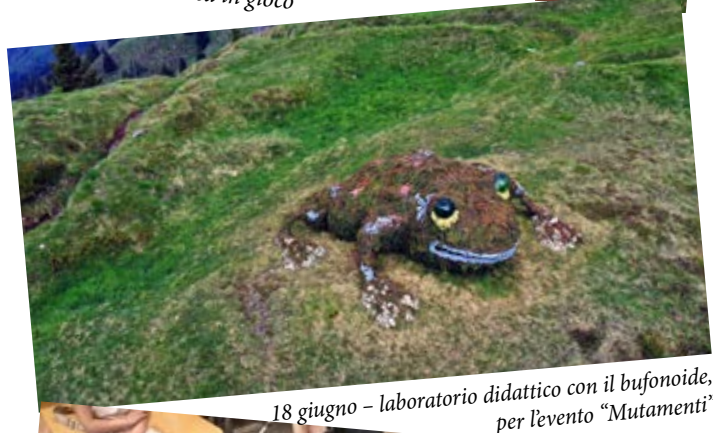
18 giugno – laboratorio didattico con il bufonoide, per l’evento “Mutamenti”