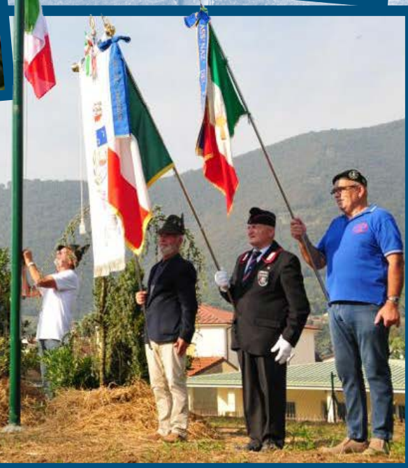
Inaugurazione Sede Alpini di Cortine di Nave