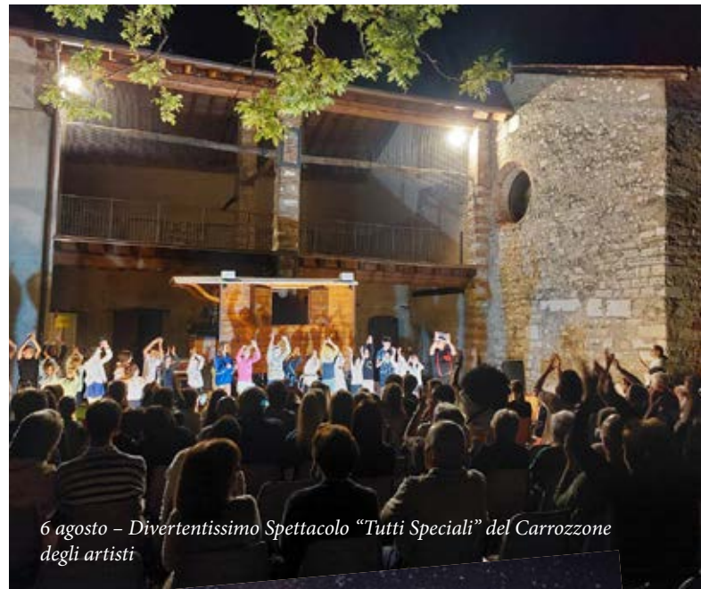
6 agosto – Divertentissimo Spettacolo “Tutti Speciali” del Carrozone degli artisti