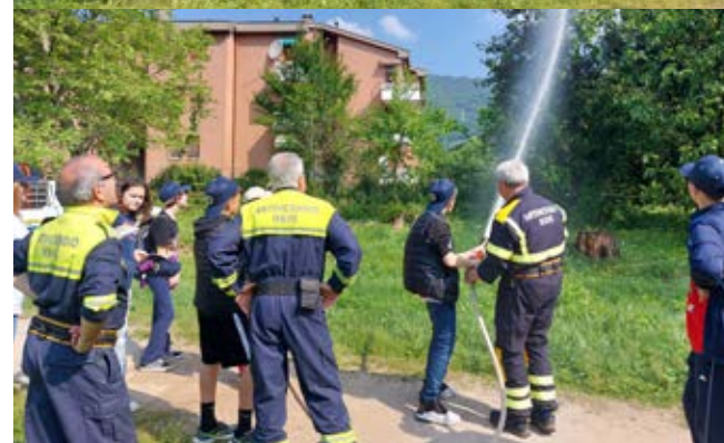
Le associazioni di volontariato della consulta sociale incontrano i ragazzi