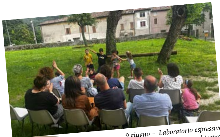
9 giugno – Laboratorio espressivo “giocare al teatro”

Una frizzante estate dedicata ai piccoli con la costellazione di proposte spuntate nel corso dell’iniziativa La “Nave dei Bambini”, ideata dall’Amministrazione Comunale. ..Ve le ricordate tutte? Che ne dite? ...Il divertimento continua?