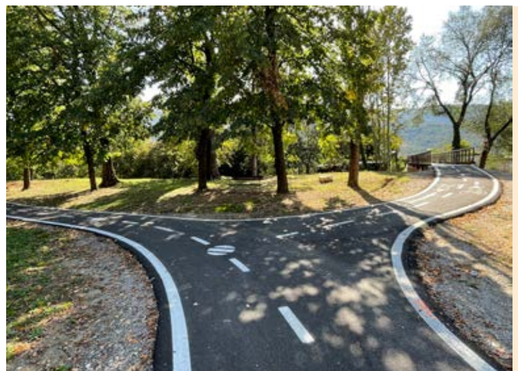
Nuovo ponte ciclopedonale parco Caprim