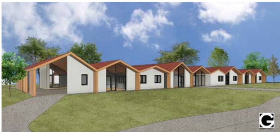
Nuovo Polo Scolastico Zero-Sei