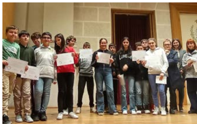
Composizioni sul tema “Il futuro ci chiama” nell’ambito del VI concorso letterario Monia Del Pero