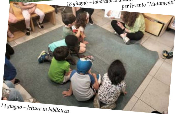
14 giugno – letture in biblioteca