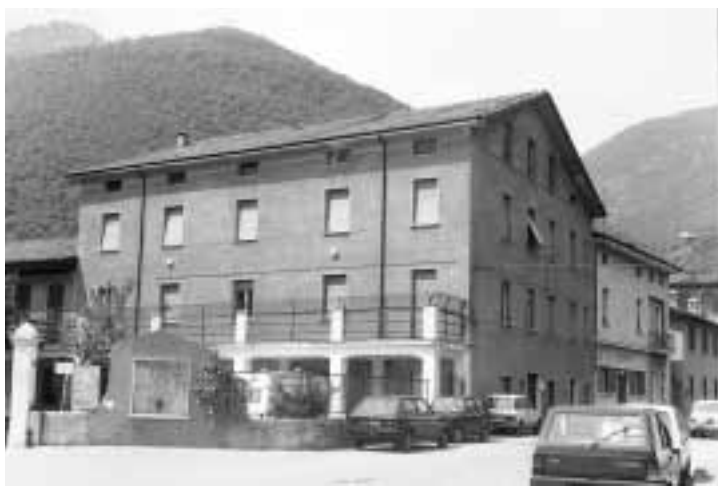
L'ex Casa di Riposo di Montecelana