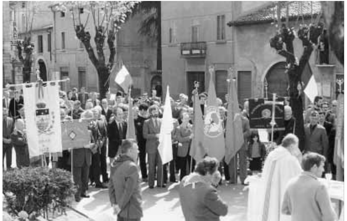
25 Aprile 1984