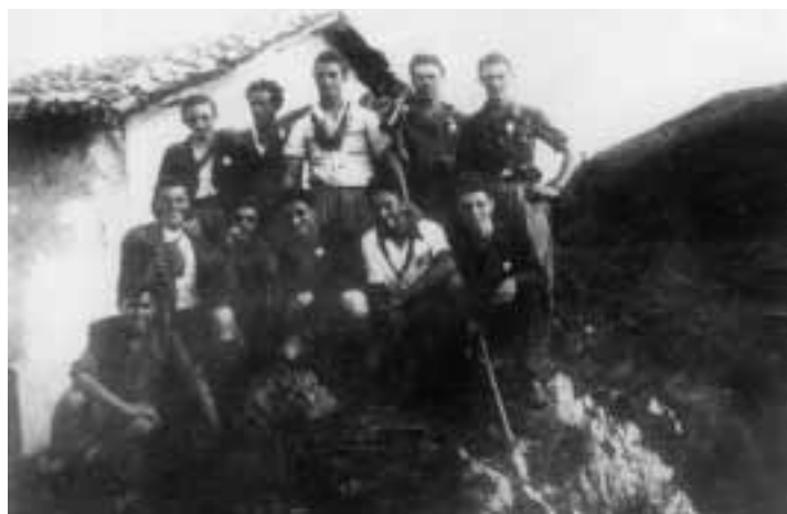
Partigiani in Conche

- renderci consapevoli che nella storia esistono non solo responsabilità individuali bensì responsabilità collettive. Tutti i cittadini di Nave sono pertanto invitati a partecipare alle seguenti manifestazioni che si svolgeranno secondo il seguente calendario: