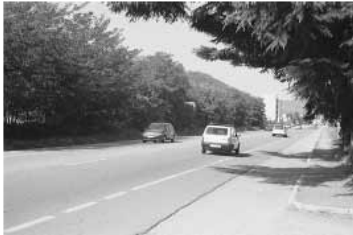
La strada provinciale

Purtroppo, tale richiesta non è stata accolta e il nostro Comune, da solo, dovrà progettare la nuova strada, così come, reperire per la sua realizzazione, le non poche risorse finanziarie necessarie, anche attraverso accordi con operatori priva-