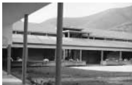
Il cimitero di Cortine

Coloro che fossero interessati, possono già rivolgersi all'Ufficio Contratti del Comune (telefono: 030-2537411, 030-2537413) per conoscere le modalità di adesione.