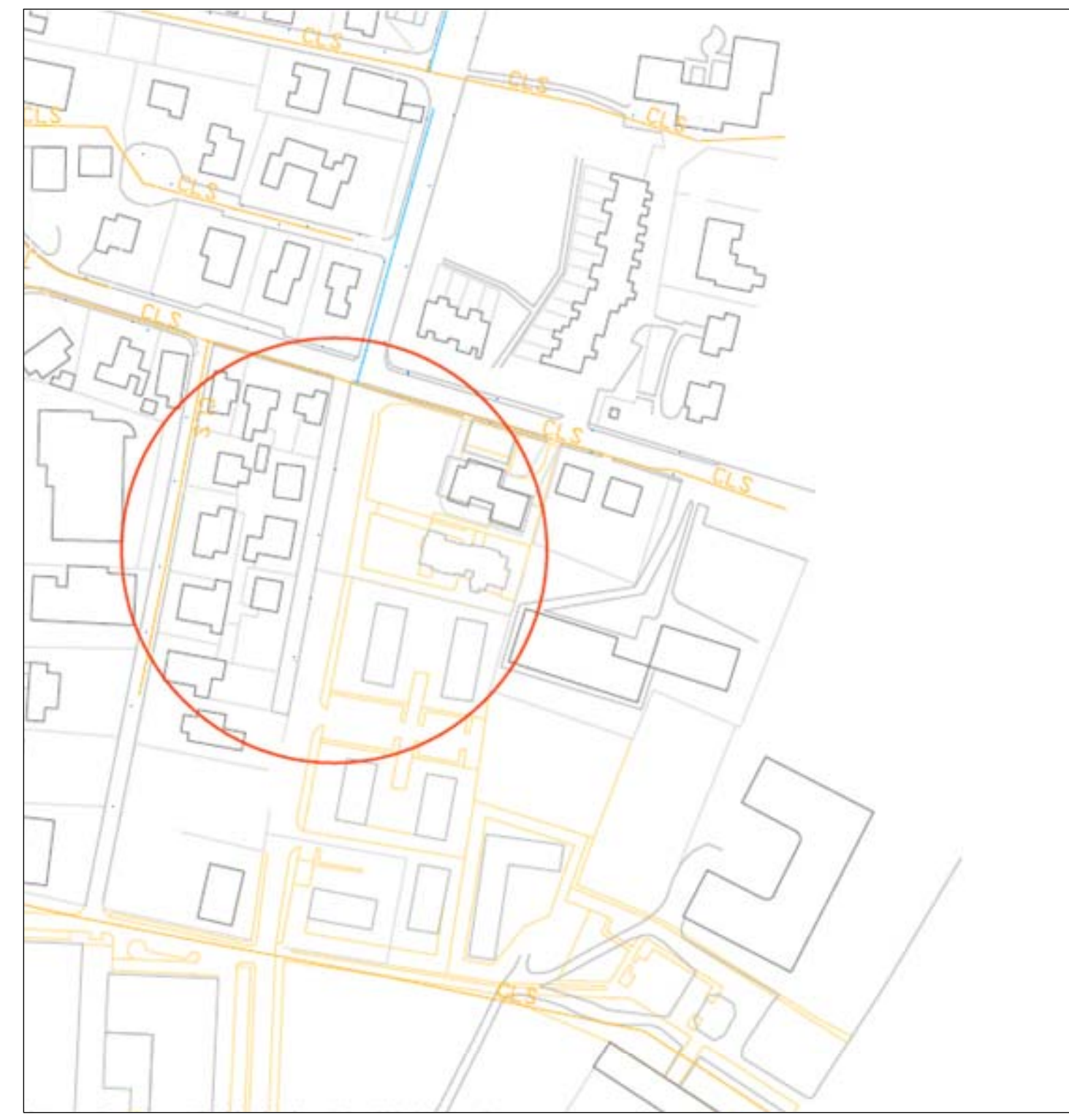
ESTRATTO MAPPA SCALA 1:2000

Studio Ing. Mario Geroldi Via Pascoli, 5 25010 Borgosatollo (Bs) Tel: 030/2501726 Fax: 030/2501725 Cell: 3383337727 mail: info@entlocali.it